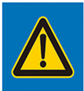
注意安全 Caution, Danger