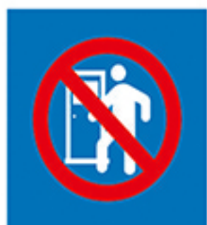
请勿擅入 Do not Trespassing