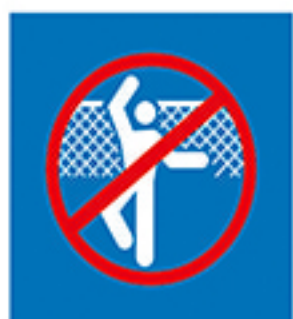
请勿翻越 Do not Climb