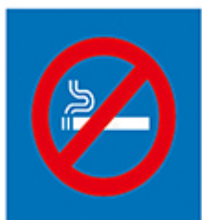
请勿吸烟 No smoking