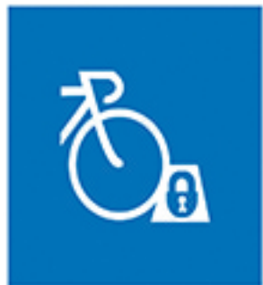
自行车停放处 Secure Bike Parking