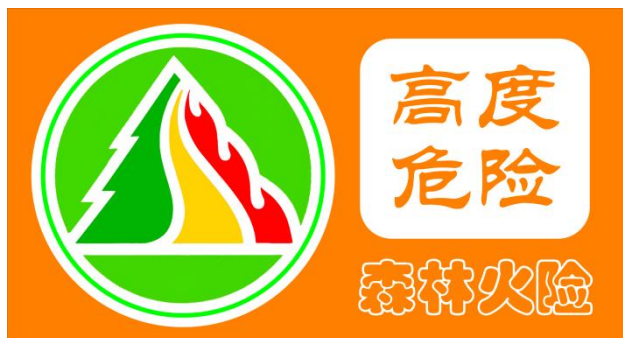
图 3 森林火险橙色预警信号标识

（四）森林火险橙色预警信号表示：未来一天至数天预警区域森林火险等级为四级，林内可燃物容易点燃，易形成强烈火势快速蔓延，高度危险。预警信号标识的底色和文字采用橙色，表示危险程度的文字为：高度危险。