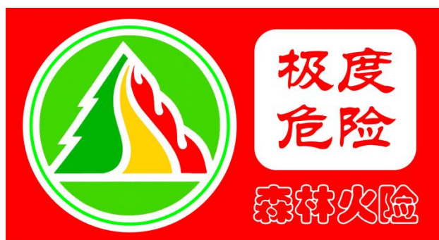
图 4 森林火险红色预警信号标识

（五）森林火险红色预警信号表示：未来一天至数天预警区域森林火险等级为五级，林内可燃物极易点燃，极易迅猛蔓延，扑火难度极大，极度危险。预警信号标识的底色和文字采用红色，表示危险程度的文字为：极度危险。